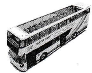
▲2021年 エクリプスジェミニ3