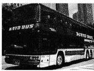
▲1982年 はとバス初の2階建てバス