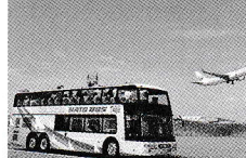
▲2022年 羽田ベストビュードライブ