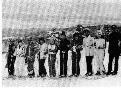
▶みんなでスキーツアー

わたしの人生で、かけがいのない鳩友会。こんな素晴らしい会に入らないのは、本当にもつたいないです。会員みんなでもっとメンバーを増やしていきたいでしょう、私も頑張りますけど、是非みなさんも参加するよう誘ってくださいね!!